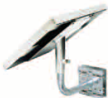
15Wソーラーパネル 取り付け架台