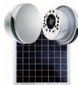
平型カバー付ユニット