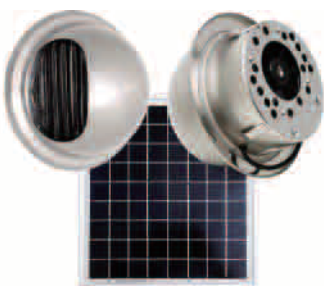
ドーム型シングルユニット