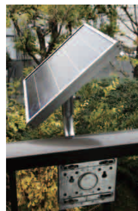
ソーラーパネル取り付け架台