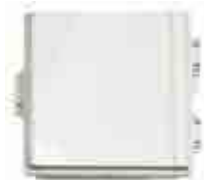
ハイブリット安定化電源