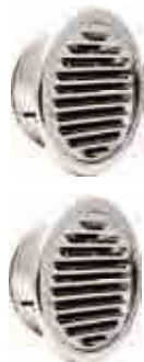
高風量平型 150 2台